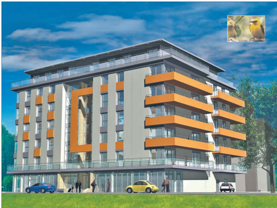
Kolonystyka elewacji Oriolusa (widok od Kobierzyńskiej) nawiązuje do upierzenia wilgi.

Oriolus to łacińska nazwa ptaka – wilgi. Jak informuje nieoceniony Adam Wajrak: Wilga jest śliczna, w odcieniach żółto-szarych i śpiewa głosem fletu, co od dawna zachwycało artystów. Wilgi przylecą do nas (z Azji) dopiero na przełomie kwietnia i maja..