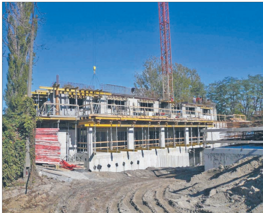
Oriolus w budowie. Garaże. Posadzka cementowa. Miejsca parkingowe będą wyznaczone liniami namalowanymi na posadzce. Brama wjazdowa uchylna, automatyczna (piloty). Garaże w części piwnicznej będą miały wentylację mechaniczną...